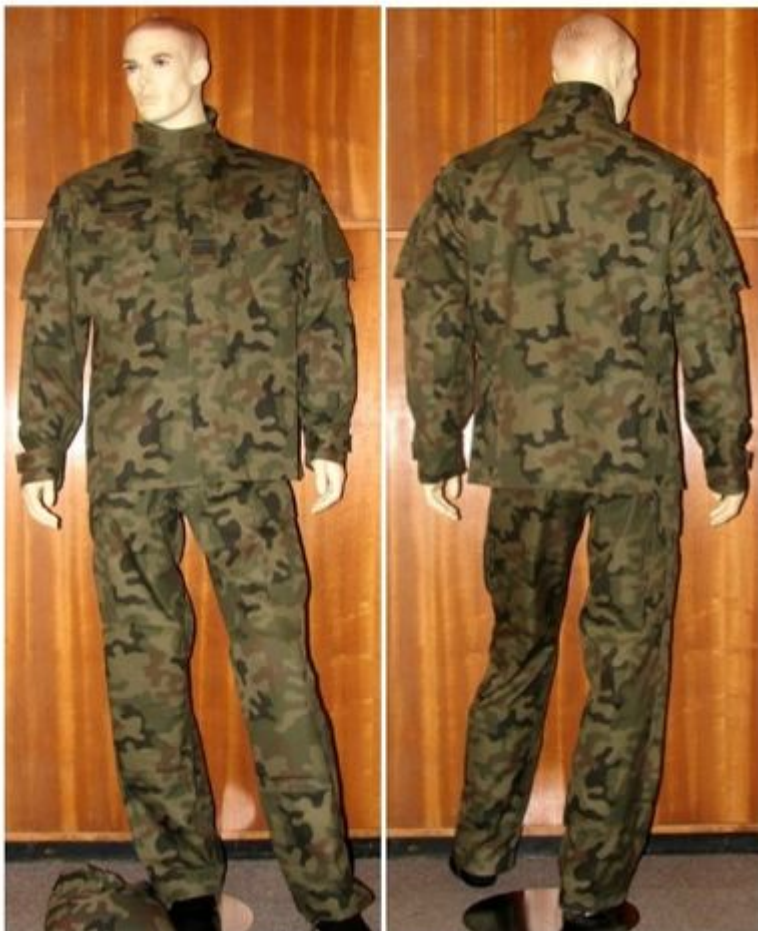
Mundur polowy wzór 2010.

Pierwsza część zamówienia dotyczy mundurów polowych letnich wzór 2010 (bluza i spodnie), natomiast pozostałe trzy są związane z dostarczeniem mundurów polowych wzór 2010 (bluza i spodnie).