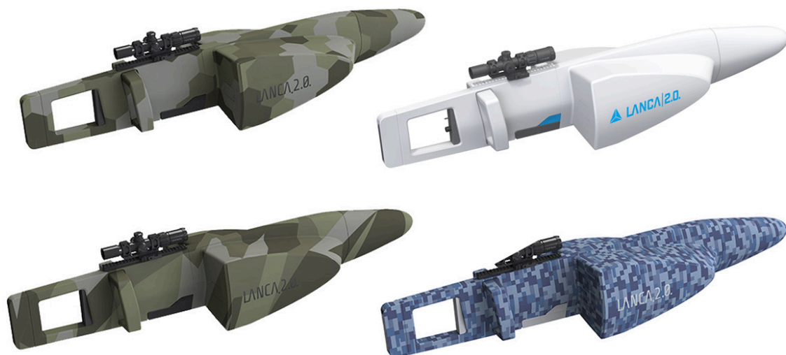
Możliwe warianty kolorystyczne Lancy 2.0. proponowane przez WZE.

Przygotowując się do indywidualnych preferencji przyszłego użytkownika Wojskowe Zakłady Elektroniczne proponują nie tylko możliwość modyfikowania wybranych parametrów neutralizatora, ale również różną kolorystykę i oznaczenia. Pomaga w tym fakt, że sam projekt wzorniczy obudowy neutralizatora powstał na zamówienie WZE w biurze projektowym JOTGIE Studio Projektowe Jakub Gołębiowski, które współpracowało z Anną Szwałą. Według autorów opracowano wtedy: „ergonomiczne i estetyczne aspekty urządzenia: kształt obudowy, umiejscowienie uchwytów, identyfikację wizualną i kolorystykę urządzenia” oraz wykonano prototypową obudowę.