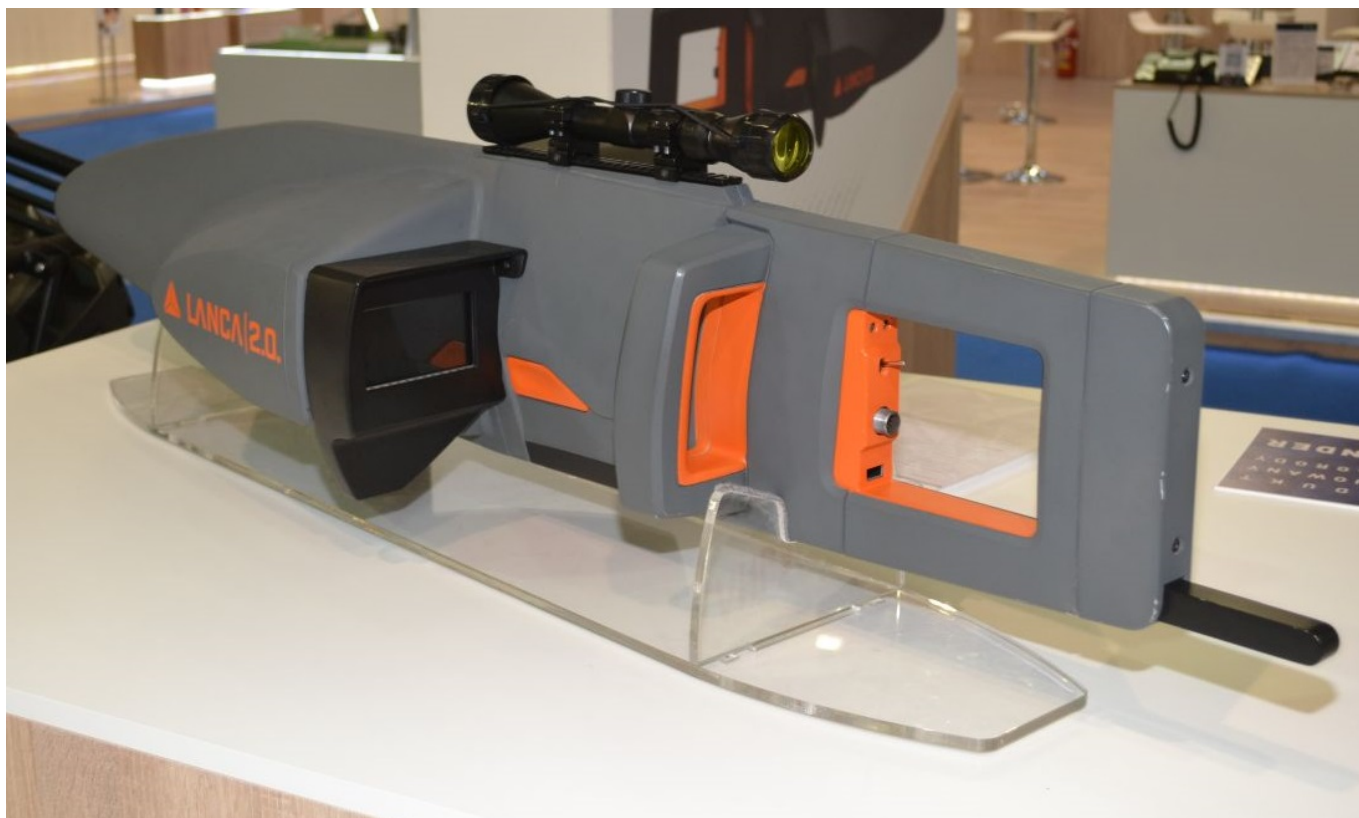
Lanca 2.0. z widocznym z lewej strony panelem dotykowym dla operatora.

Całe urządzenie zostało bowiem wkomponowane w obudowę przypominającą karabin żołnierza przyszłości. I jest w tym porównaniu dużo racji, ponieważ Lanca 2.0. nie strzela do dronów kulami, ale wysyłając „szkodliwe” dla bezzałogowców promieniowanie elektromagnetyczne. Już poprzednia wersja urządzenia mogła zakłócać pasmo od 100 MHz do 6 GHz. Według przedstawicieli WZE Lanca 2.0. ma obecnie jeszcze bardziej zwiększony zakres zakłócanych częstotliwości z zapasem pokrywająca wszystkie pasma, jakie są wykorzystywane w komercyjnych dronach.