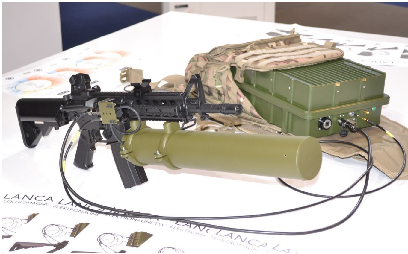
Lanca Elektromagnetyczna prezentowana przez WZE w 2017 r.

Dzięki temu nie ma już potrzeby stosowania oddzielnego plecaka zawierającego system zasilania oraz bloki odbiornika i nadajnika zakłóceń połączonych z odseparowanym systemem antenowym (podwieszanym np. pod lufą karabinka szturmowego na zasadzie podobnej jak w przypadku granatników) dwoma przewodami (jeden do przekazywania do anteny sygnału zakłócającego, a drugi do przekazywania z anteny sygnału „łączności” odbieranego od drona - dzięki czemu zmiana częstotliwości urządzenia radiowego na bezzałogowcu, automatycznie powodowała zmianę częstotliwości sygnału zakłócającego). W ten sposób w Lancy 2.0. udało się nie tylko zmniejszyć wagę przenoszonego wyposażenia, ale przede wszystkim poprawić mobilność żołnierzy i zwiększyć swobodę ich poruszania się (ograniczoną wcześniej np. dodatkowym plecakiem, czy przeszkadzającymi w ruchu przewodami połączeniowymi). O wiele łatwiejsza jest też obsługa, ponieważ wszystkie elementy Lancy 2.0. potrzebne do jej wykorzystania i kontroli operator ma teraz przed sobą, a nie na plecach.